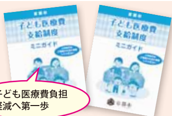
子ども医療費負担 軽減へ第一歩