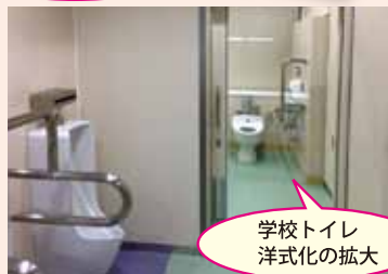
学校トイレ 洋式化の拡大