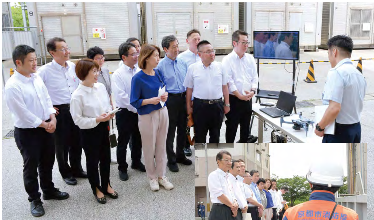
消防活動総合センターで説明を受ける公明党京都市会議員団

公明党京都市会議員団は5月20日に「消防活動総合センター」で、消防用ドローンの運用、水災害対応訓練、能登半島地震に伴う緊急消防援助隊の活動について視察を行いました。消防用ドローンは、災害発生時の上空からの情報収集や消防職員が立ち入ることが困難な地域や場所の情報収集を行い、昨年度は火災現場や救助活動で合計39件出動していま